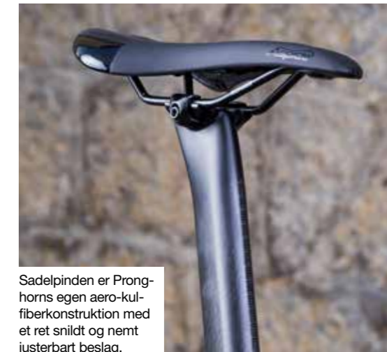
Sadelpinden er Pronghorns egen aerokulfiberkonstruktion med et ret snildt og nemt justerbart beslag.

Pronghorn stiller til test med en komplet Shimano Ultegra Di2 Disc-gruppe. Skiverne er dog fra konkurrenten SRAM i str. 140mm. Sadlen er San Marco Aspide og dækene Continental Grand Prix 4000S i 28mm. Hjulsættet er Pronghorns eget